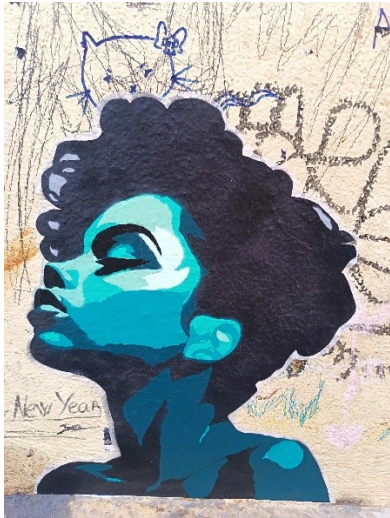
Graffiti a Sohóban.