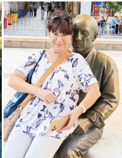
Picasso ölében a Merced téren.

Málaga a múzeumok városa is. A Museo Picasso a város legkiemelkedőbb kulturális intézménye, több mint 230 műalkotást tartalmaz. A múzeumnak a 16. századi Palacio de Buenavista épülete ad otthont, amely maga is jelentős történelmi és építészeti értékkel bír.