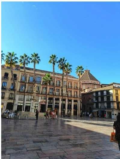
Plaza de la Constitución

A Teatro Romano, vagyis Római Színház a város egyik legfontosabb történelmi műemléke, amely a római kor lenyűgöző örökségét képviseli.