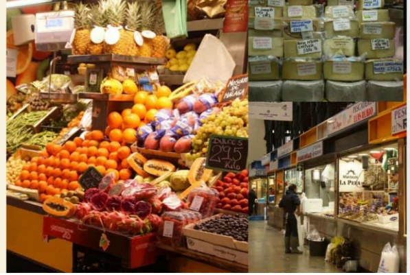
Ez volt a feladatunk a piacon.

◆ "Compare the Atarazanas market with a regular supermarket chain like Aldi, Lidl or Carrefour. Register differences in products, colors and presentation methods?" → Examples: local vs. imported products, processed vs. fresh food, packaging, brands, tradition, etc.