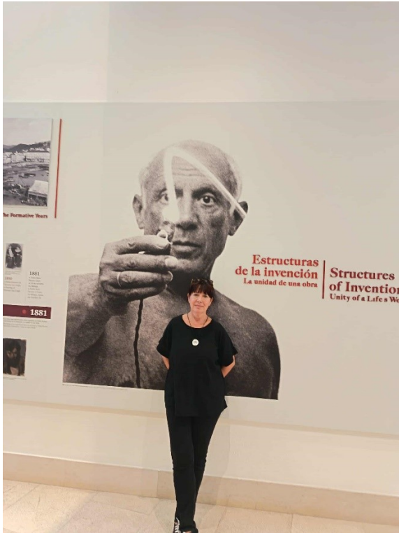
A nő Picasso előtt....