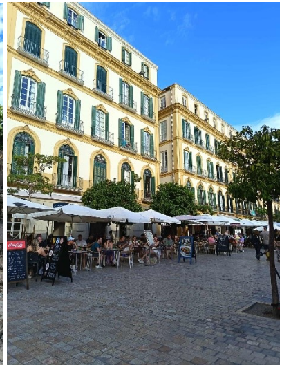
„Törzshelyünk”, a Merced tér.

A Teatro Romano, vagyis Római Színház a város egyik legfontosabb történelmi műemléke, amely a római kor lenyűgöző örökségét képviseli.