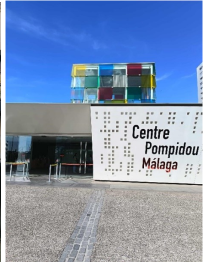
A Pompidou múzeum