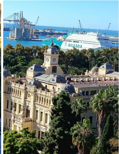
Kilátás a Gibralfaróból.