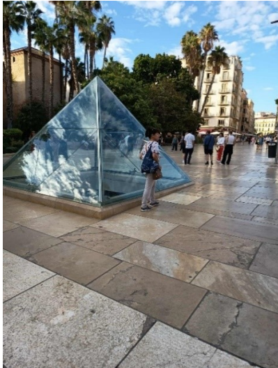
Pirámide de Cristal...