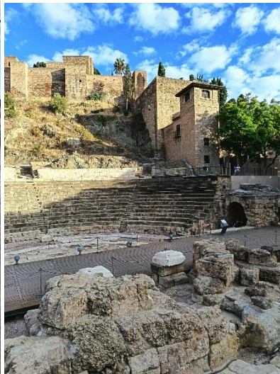
a Teatro Romano mellett.