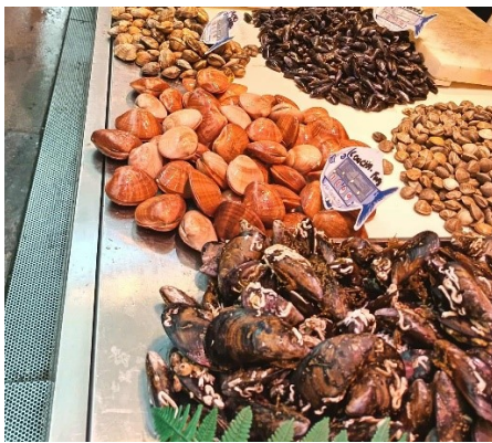
A halpiac mindig a legérdekesebb.

◆ "Compare the Atarazanas market with a regular supermarket chain like Aldi, Lidl or Carrefour. Register differences in products, colors and presentation methods?" → Examples: local vs. imported products, processed vs. fresh food, packaging, brands, tradition, etc.