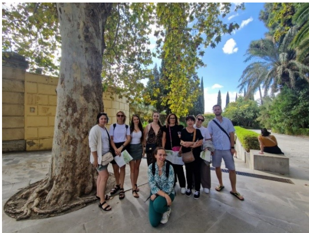
A csoport a botanikus kertben.