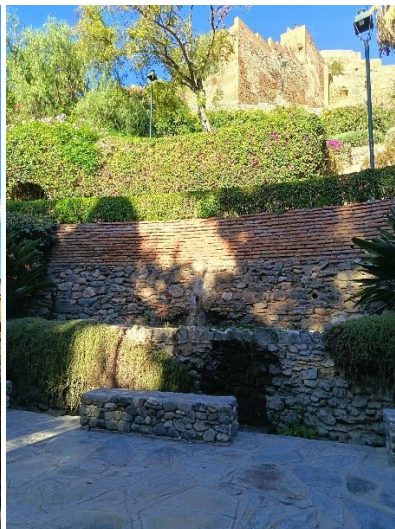
Az Alcazaba, vagyis a mór erőd.