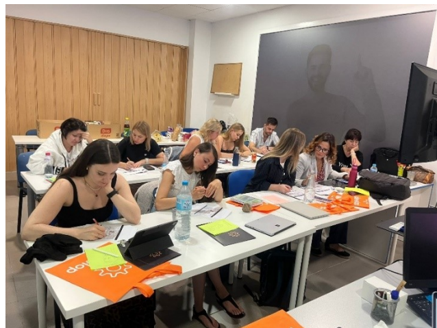
A csapat elmélyült munka közben.

A 3. napon meglátogattuk a város híres botanikus kertjét, a Jardín Botánico Histórico La Concepción parkot, amely több mint 150 éves történelemmel rendelkezik. A kertben trópusi és szubtrópusi növényeket, kis patakokat, tavakat, vízeséseket és történelmi emlékeket csodálhattunk meg, míg a kijelölt feladatokat megoldottuk.