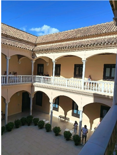
Palacio de Buenavista