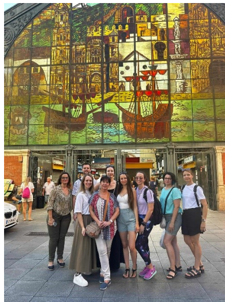
A piac ólomüveg ablaka előtt.