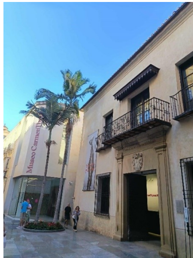
A Carmen Thyssen múzeum