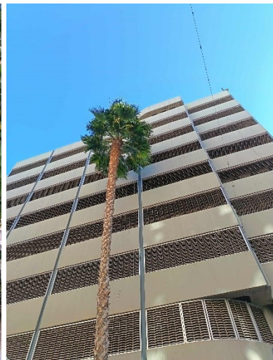
Irodaház a Sohóban.