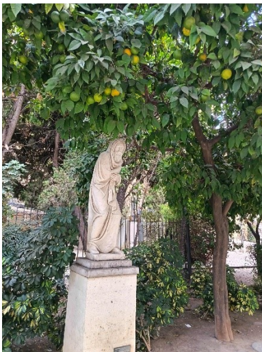
Narancsfák a téren.

A repülőtérrel -metró kinézetű és gyorsaságú- vonattal mentünk be a központba, s ahogyan kiléptünk az állomásról, szinte mellbevágott a hőség (kora délelőtt is volt már vagy 28 fok) és a város hihetetlen pezsgése, energiája. A belvárosban egy futóverseny után egy vallási körmenetbe botlottunk, október végén is turisták tömege hullámozott az utcákon. Az égbeszökő pálmafák levelei között kis zöld papagájok zajongtak, az utcákon mindenütt narancs- és citromfák, virágzó magnólia és még sokféle egzotikus növény. A különböző történelmi korok emlékeinek a legmodernebb építészeti megoldások adtak sajátos kontrasztot. Lenyűgöző volt az összkép.