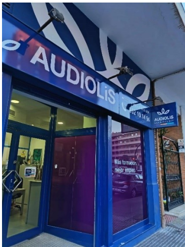
A képző bejárata.

A könnyedség, humor végig jelen volt az órákon, rengeteget játszottunk, nevtünk, s közben olyan égetően fontos és időszerű kérdésekről beszélgettünk, mint a fenntarthatóság, a klímavédelem, a környezettudatos életvezetés, a környezetszennyezés forrásai és a lehetséges megoldások, a hulladékfeldolgozás, az újrahasznosítás és még számos más téma.